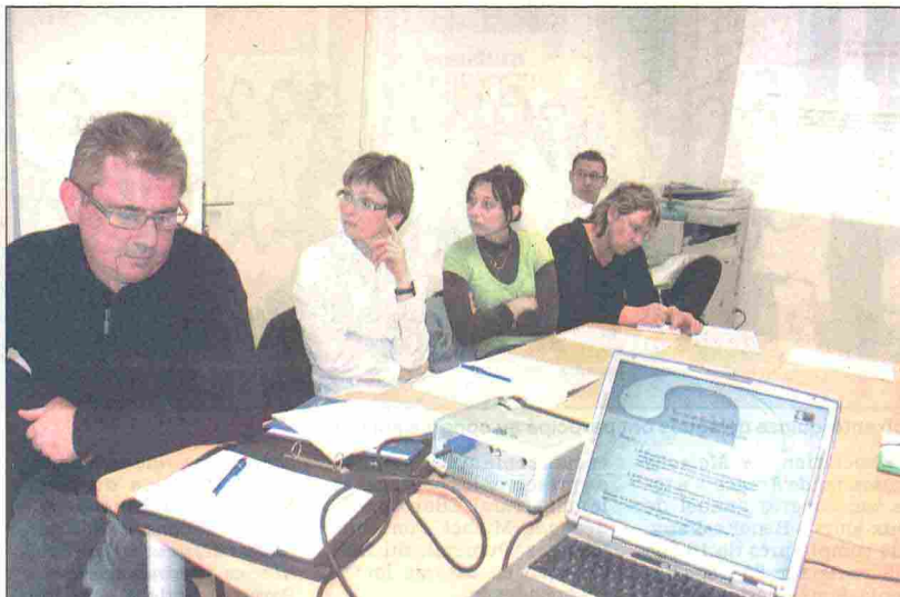
Une dizaine de personnes ont assisté à cette réunion.

Mais pour ceux qui ont le droit de créer leur propre auto-entreprise, leur activité manque de reconnaissance pour être principale : « Vous ne pouvez signer de bail commercial et donc vous avez toutes les chances d'être invité à quitter votre local plus fréquemment que dans le cas d'une micro-entreprise, où un bail commercial dure neuf ans. De plus vous ne pouvez bénéficier d'aide à la création d'entreprise ni du conseil général ni de l'Agefiph si vous êtes travailleur handicapé. »